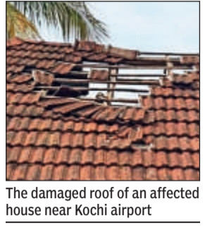
The damaged roof of an affected house near Kochi airport

"If a house owner is to seek compensation from an airline company, it will be a long and strenuous process. Moreover, the involvement