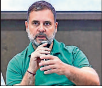
DMK mouthpiece said INDIA bloc parties' chiefs, including SP's Akhilesh Yadav & RJD's Tejashwi Yadav, expressed dissatisfaction over Cong's handling of allies

Questioning Congress leadership's approach towards allies, the DMK mouthpiece asked, "Isn't Congress ashamed to first weaken alliance partners and then seek their support when the need arises?"