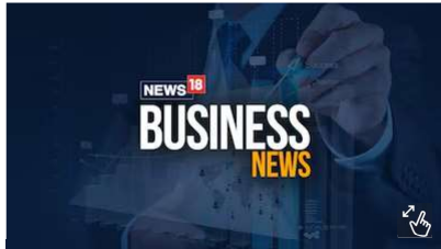
Representational image (Image: News18)

Jaipur, May 15 (PTI) Digital service solutions provider Infinity Infoway Limited on Friday said it has developed an AI-powered platform for secured printing and distribution of confidential documents, including question papers for educational institutions and competitive examinations.